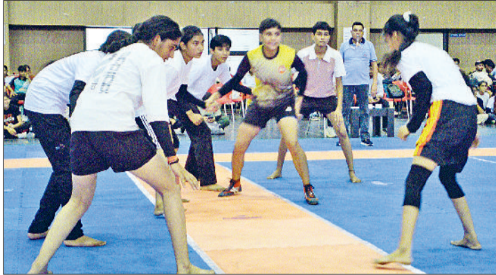
सिरसा। कबड्डी प्रतियोगिता में भाग लेती छात्राएं।