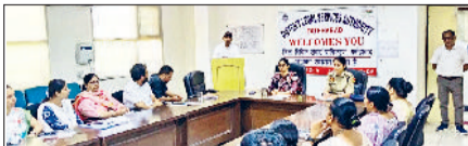
फतेहाबाद। एडीआर सेंटर में नई दिशा नई उड़ान विषय पर सेमिनार को संबोधित करते वक्ता।