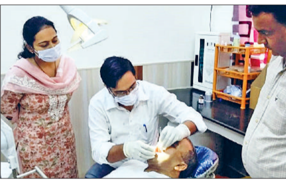
भट्टकलां। लोगों की स्वास्थ्य जांच करते चिकित्सक।