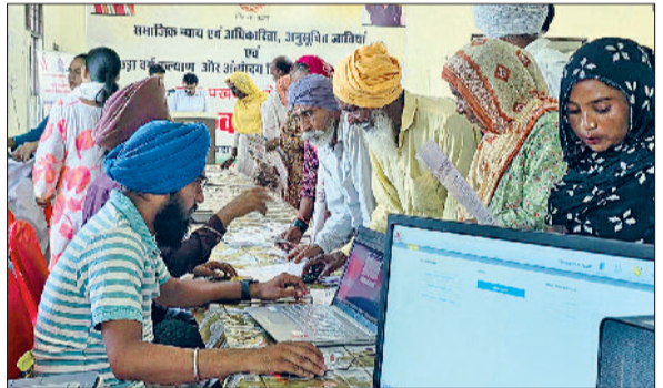
सिरसा। शिविर में मरीजों के स्वास्थ्य की जांच करते चिकित्सक।

से अनेक जीवनोपयोगी बातें बताईं जो प्रत्येक नागरिक के लिए बहुत जरूरी है।