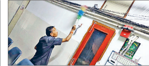
फतेहाबाद। सेवा पखवाड़ा के तहत एडीसी कार्यालय में साफ सफाई करते कर्मचारी।