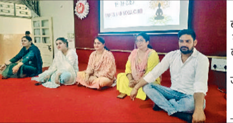
फतेहाबाद। बीएड कॉलेज में विद्यार्थियों को मेडिटेशन बारे जानकारी देते स्टाफ सदस्य।

मनोहर मेमोरियल कॉलेज आफ एजुकेशन में आज मेडिटेशन सेमिनार का आयोजन किया गया। इस आयोजन का संचालन स्पोर्ट्स एवं योग क्लब की तरफ से किया गया। इस सेमिनार में कॉलेज के विद्यार्थियों ने उत्साहपूर्वक भाग लिया और मेडिटेशन का अभ्यास किया। मेडिटेशन सेमिनार में विद्यार्थियों के मानसिक स्वास्थ्य व शारीरिक स्वास्थ्य पर बल देने के लिए विद्यार्थियों को प्रेरित किया