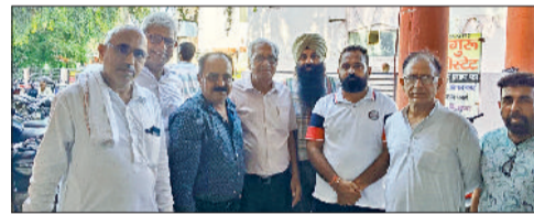
फतेहाबाद। डीसी से मिलने पहुंचे व्यापारी नेता।