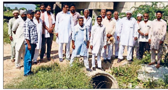
सिरसा। सिंचाई विभाग के खिलाफ रोष जाहिर करते किसान।

क्षेत्र के गांव चौटाला के ग्रामीणों ने गुरुवार को चौटाला माइनर की टेल पर सिंचाई विभाग के खिलाफ अनिश्चितकालीन धरना शुरू कर दिया। इससे पहले किसानों ने प्रशासनिक अधिकारियों को जापन सौंपकर टेल पर पीने का पानी पहुंचाने की फरियाद की थी, लेकिन 3 सप्ताह के बाद भी प्रशासन के कानों तक आवाज नहीं पहुंची। आखिरकार टेल के किसानों ने चौटाला नहर की टेल पर अनिश्चितकालीन धरना शुरू कर दिया। सूचना पाकर विभाग के जेई