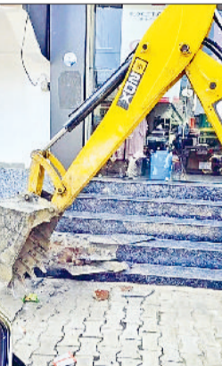
हरिभूमि न्यूज ► फतेहाबाद